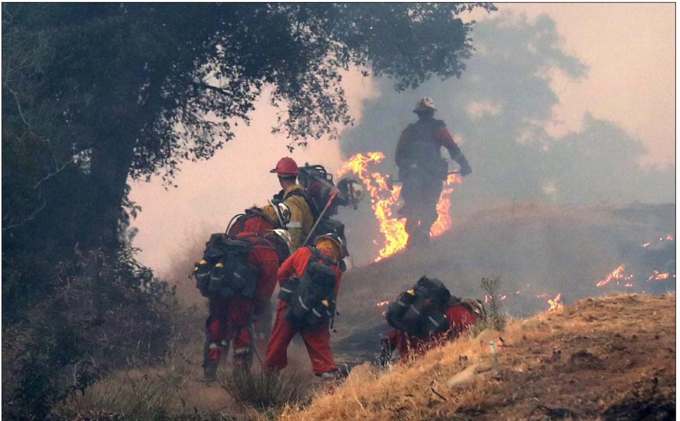
Des pompiers combattent les flammes dans un verger d'avocatiers de la ferme Ojai Vista menacée par l'incendie Thomas près d'Ojai, Californie, É.-U., le 7 décembre 2017.